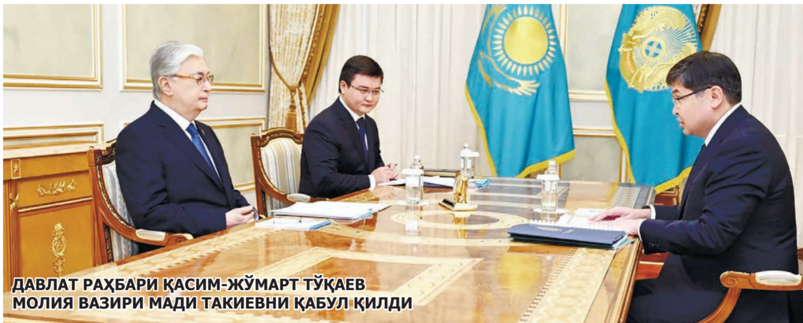
ДАВЛАТ РАҲБАРИ ҚАСИМ-ЖЎМАРТ ТЎҚАЕВ МОЛИЯ ВАЗИРИ МАДИ ТАКИЕВНИ ҚАБУЛ ҚИЛДИ

ҚРнинг ДАВЛАТ БЮДЖЕТИ УЧ ОЙДА 4,5 ТРИЛЛИОН ТЕНГЕГА ОШДИ