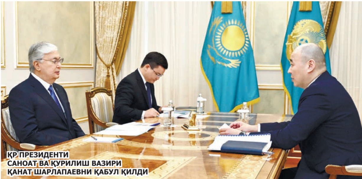
ҚР ПРЕЗИДЕНТИ САНАТ ВА ҚУРИЛИШ ВАЗИРИ ҚАНАТ ШАРЛАПАЕВНИ ҚАБУЛ ҚИЛДИ

Шунингдек, ижарага бериладиган 22 мингта уй-жой барпо этиш учун давлатдан 300 мил-